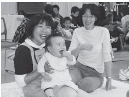
子どもの健やかな成長を願って