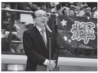
選手の健闘を祈ってあいさつ(16日)