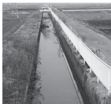
電台地先の農業用水路

夕方の放送「夕焼け小焼け」の時刻は、4月1日(火)から、午後6時(3月31日(月)までは午後5時)に変更します。 ※くわしくは危機管理課(☎20・1523)へ。