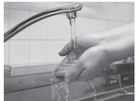
快適な生活に欠かせない水道

市では、市営水道・市営簡易水道・公共下水道の料金・使用料に関する事務を(株)ジェネッツに委託しています。