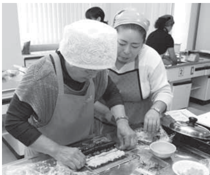
きれいに具を並べて