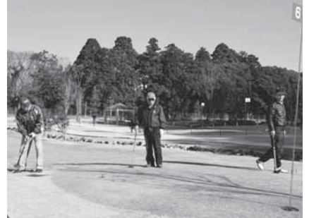
カップインを狙って

※申し込みは3月7日(金)までに市レクリエーション協会事務局(生涯スポーツ課・☎20-1584)へ。