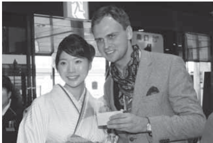
日本酒でおもてなし(新春航空安全祈願祭)