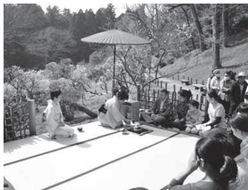
公園の木々に囲まれて野だてを

内容 年男や有志による豆まき ※くわしくは観光プロモーション課(☎20・1540)へ。