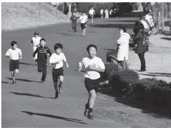
ゴールを目前にスパートする選手たち