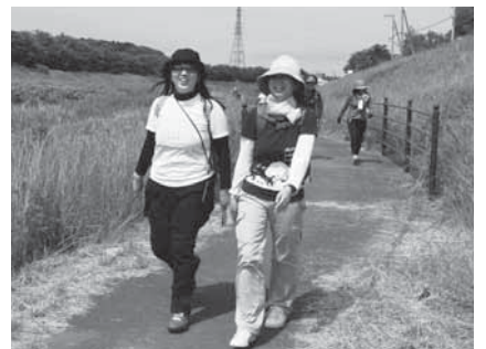
緑豊かな自然を満喫

※くわしくは成田エアポートツーデーマーチ実行委員会事務局(観光プロモーション課・☎20-1540)または同公式ホームページへ。