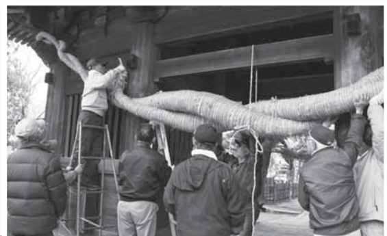
仁王門に新しく飾られる大きな注連縄

龍正院で1月8日、仁王門(国指定重要文化財)の注連縄 しめなわ の奉納が行われました。龍正院では、江戸時代の享保年間(1716~1736年)のころ、門前通りで火災が発生した際に、仁王門に安置された仁王様が大きなうちわで火をあおり返して本堂や民家を守ってくれたという言い伝えがあります。このことに感謝して、火災を免れた土地に住む人たちが毎年1月8日に注連縄を奉納します。秋にとった稲わらを持ち寄り、作業は午前8時ごろから午後3時ごろまでかかります。ことしも見事な注連縄が仁王門に掛けられました。