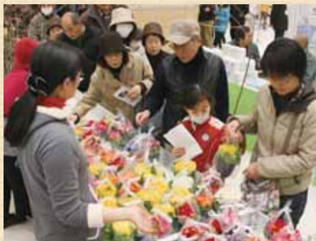
色とりどりの花の苗を配布

確定申告の時期が近づきました。ことしから所得税に復興特別所得税の申告が加わっています。東日本大震災からの復興施策に必要な財源を確保するために創設されたものです。話は変わりますが、先日、職場の旅行で被災地の仙台市周辺を訪れました。最近、社員旅行でも被災地への復興支援旅行が定番になりつつあるともいわれています。震災後に東北へ行くのは初めてでした。強く印象に残ったのは、太平洋沿岸部の被災地を走る観光バスの中から見た、延々と広がるさら地で復興作業を進める重機類の姿と、津波の被害で損壊した家屋が所々に残されている光景でした。あらためて、犠牲者の冥福と被災地の日も早い復興を祈らずにいられませんでした。