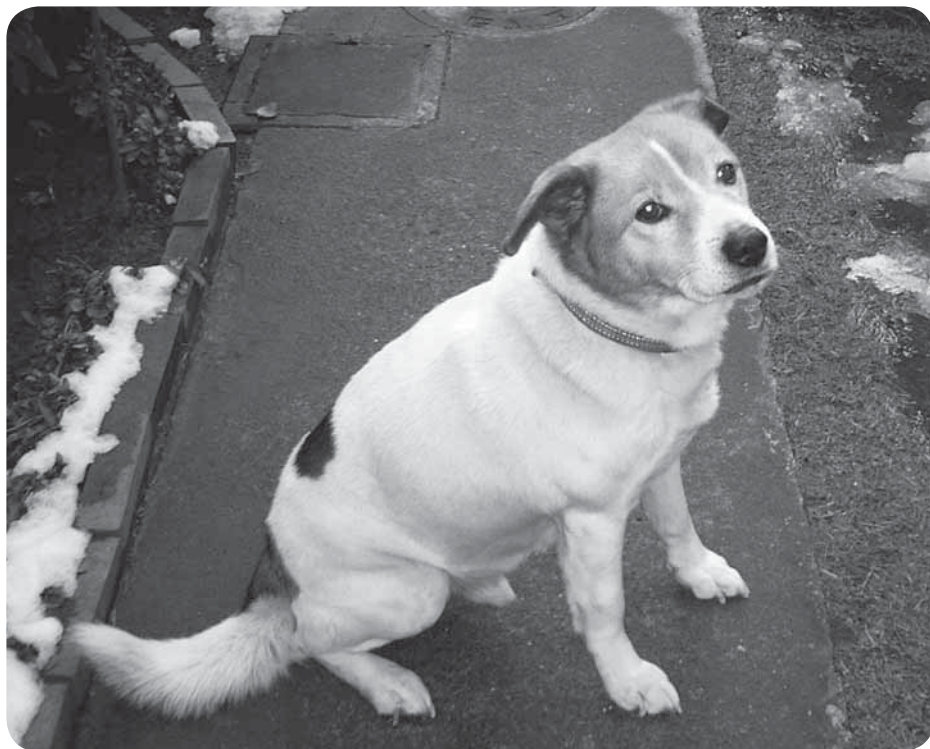
飼い主は責任ある飼い方を