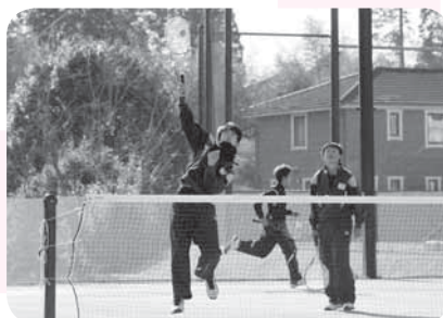
強烈なスマッシュ

全体練習が始まる前などにも練習しています。言葉だけでなく行動でも部員を引っ張っていきたいです。