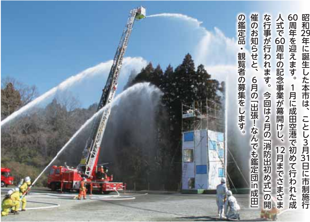
消防隊による一斉放水(消防出初め式)

昭和29年に誕生した本市は、ことし3月31日に市制施行60周年を迎えます。1月に成田空港で初めて行われた成人式で60周年の記念事業が幕開けし、12月までさまざまな行事が行われます。今回は2月の「消防出初め式」の開催のお知らせと、6月の「出張！なんでも鑑定団in成田」の鑑定点・観覧者の募集をします。