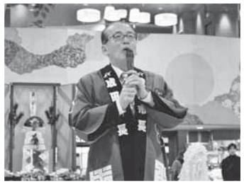
航空安全祈願祭であいさつ(1日)

車道や歩道に張り出している樹木や倒木などは、歩行者や自動車などの通行の妨げとなります。土地の所有者は、樹木の伐採や枝払いをするなど、適正な管理をお願いします。 歩行者や自動車などの事故が発生した場合、土地の所有者が賠償