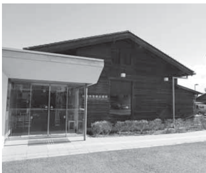
保健福祉館の敷地内に立つ急病診療所