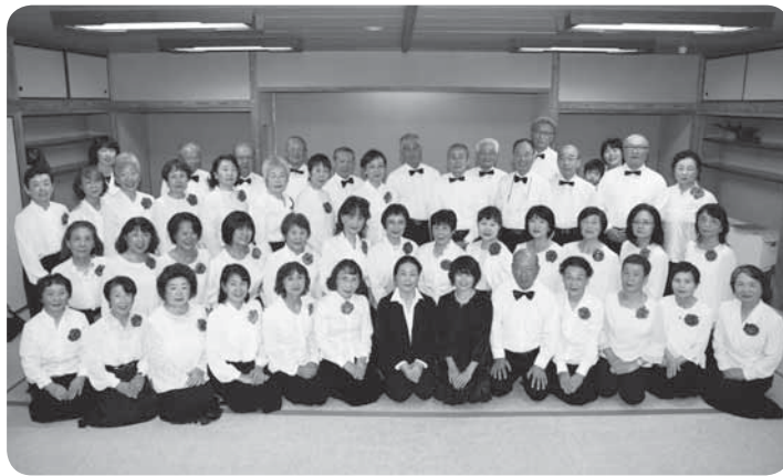
公民館まつりのステージを終えてほっと一息

普段の練習は、発声練習から始まり、メンバーの好きな歌をみんなで歌うことが多いのですが、イベントなどで披露するような曲になると、ほぼ1年かけて準備します。現在は新たに「美しく青きドナウ」の練習を始めたところです。大所帯とあって、メンバー一人一人の合唱の経験も技量もさまざま。そんなわたしたちに先生はいつも「大きな声で気持ちよく歌いましょう」とおっしゃいます。サークルに参加した当初は、恥ずかしそうに小さな声で歌って