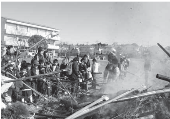
広々としたグラウンドでどんど焼きを楽しむ参加者たち