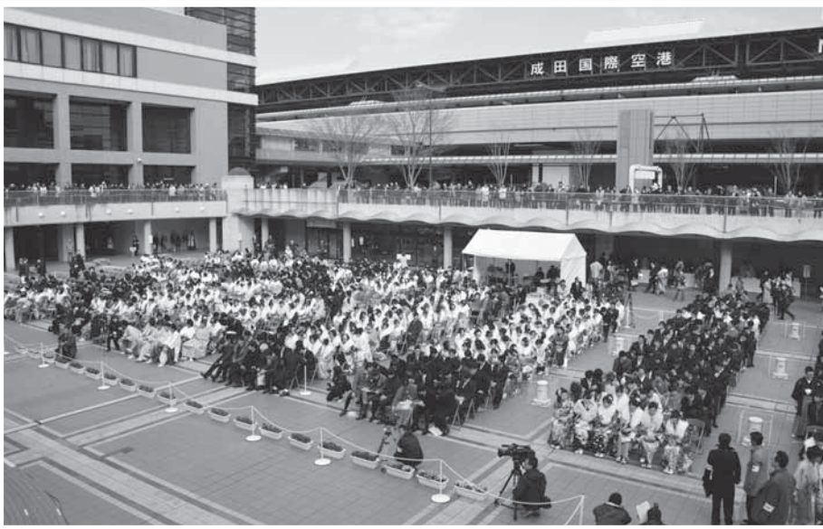
2階に居る保護者に見守られる新成人