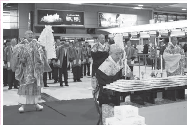
成田山新勝寺の僧侶が安全を祈願

航空機と空港利用者の旅の安全を祈る「新春航空安全祈願祭」が1月1日、成田空港で行われました。空港関係者らが見守る中、成田山新勝寺の僧侶が安全法楽を行い、成田空港に乗り入れる航空会社などに護摩札が授与されました。会場の周辺には、厳かな式典の様子を、立ち止まって珍しそうに見つめる旅行客の姿もありました。