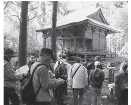
昨年は東光寺薬師堂を見学(久住地区)

時間=午前8時30分~正午 対象=成人 定員=各20人(先着順) 参加費=無料 久住地区 期日=3月1日(土)(雨天決行) 集合場所=荒海共同利用施設 内容=荒海・飯岡地区に残る貝塚や寺社などの史跡を歩いて巡り歴史を学ぶ 申込先=久住公民館(☎36-1646) 大栄地区 期日=3月15日(土)(雨天決行) 集合場所=奈土公民館 内容=奈土地区に残る奈土貝塚や大須賀氏に関連する寺社などの史跡を歩いて巡り歴史を学ぶ 申込先=大栄公民館(☎73-7071) ※申し込みは午前9時~午後5時に各申込先(月曜日・祝日は休館)へ。