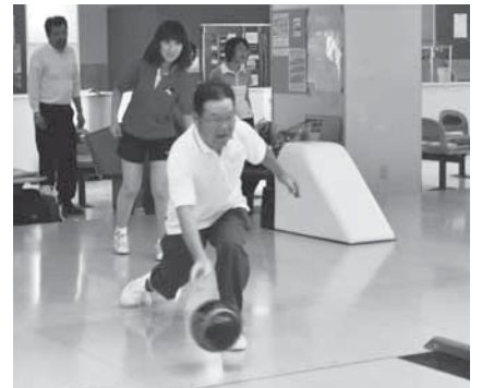
正しいフォームで投球

持ち物 = 運動のできる服装、靴下、タオル ※申し込みは11月7日(木)までに市体育協会事務局(生涯スポーツ課・☎20-1584)へ。