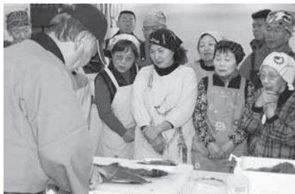
プロの包丁さばきに目が釘付け

日時=11月20日(水) 午前10時30分~午後1時 会場=成田市場マグロせり場 内容=カツオ・アジ・イカの鮮度の見分け方とさばき方・おろし方を学ぶ 定員 =30人(先着順) 参加費 =1,000円 持ち物 =出刃包丁・まな板・エプロン・三角巾 ※申し込みは11月5日(火)から成田市場振興協議会(☎24-1224)へ。