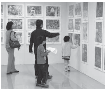
世界の文化を映し出す絵画がズラリ