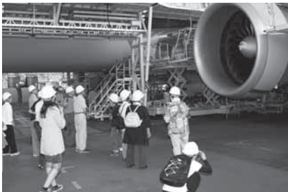
整備中の飛行機を見学

申込方法=10月22日(火)(当日消印有効) までに、はがき・FAX・Eメールのい ずれかで住所・氏名(フリガナ)・生年月 日・電話番号・職業を広報課(〒286- 8585 花崎町760 FAX24-1006 E メールkoho@city.narita.chiba.jp)へ ※くわしくは同課(☎20-1503)へ。