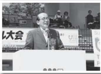
ゲートボール大会の開会式で(21日)