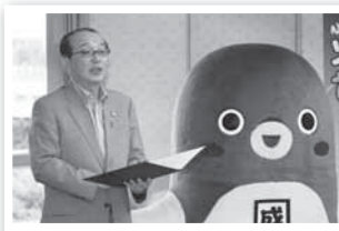
認証式であいさつ(20日)