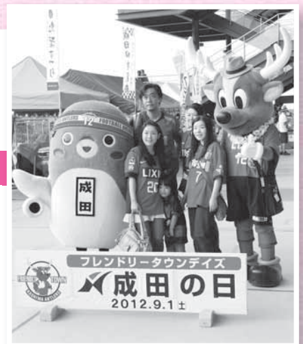
「うなりくん」「しかお」と記念撮影

サッカー J1リーグ・鹿島アントラーズ対ヴィッセル神戸戦に市民を招待・優待する「フレンドリータウンデイズ2012・成田の日」が9月1日、カシマサッカースタジアムで開催されました。スタジアムに設けられた市のPRブースでは、特産品の販売、和太鼓・三味線の演奏、キャラクターとの記念撮影が行われました。普段入ることのできないインタビュールーム・選手控室を巡るスタジアム見学ツアーに参加者は大喜び。ピッチでは市内スポーツ少年団の子どもたちによるミニゲームも行われました。試合は、前半に先制した鹿島アントラーズが1対0で勝利しました。