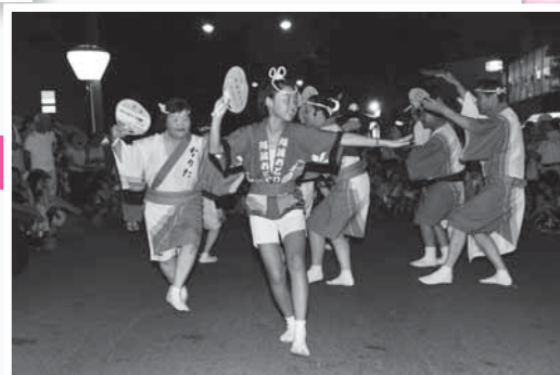
軽快なリズムに乗って

厳しい残暑が続いた8月25日・26日、ボンベルタ百貨店周辺で「成田ふるさとまつり2012」が行われました。出店が立ち並ぶおまつり通りでは、御輿や山車などが曳き廻されたほか、中央ステージでは、歌や踊りや吹奏楽の演奏などが披露され、2日間にわたりニュータウンが熱く盛り上がりました。