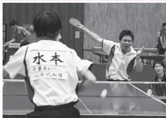
激しい打ち合いの末、気合いのこもった一打が