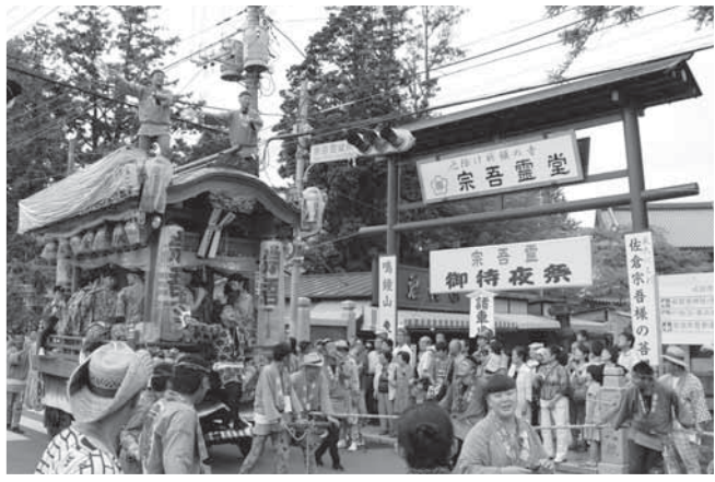
祭りに彩りを添える屋台の曳き廻し