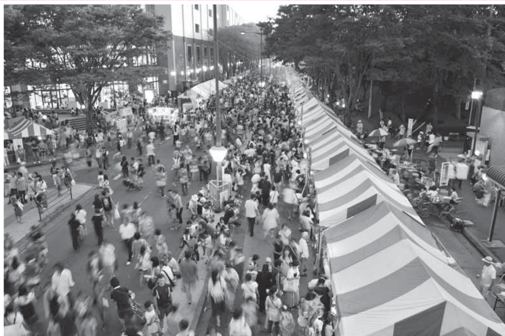
夕暮れ時になり、大にぎわいのおまつり通り