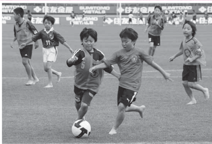
憧れのピッチで 思い切りプレー