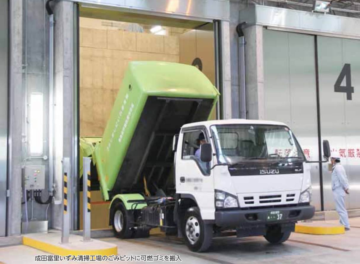
成田富里いずみ清掃工場のごみピットに可燃ゴミを搬入