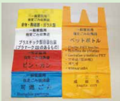
新しい指定ごみ袋

変更前の旧指定ごみ袋は、新しい分別区分に従えば、平成25年3月31日まで使うことができます。