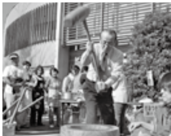
もちつきに挑戦(28日)