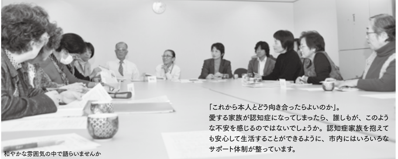
和やかな雰囲気の中で語りませんか