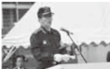
消防団員を激励(24日)