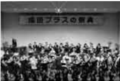
高校生たちの息の合った演奏

日時=11月28日(日) 午後1時30分開演(開場は午後1時) 会場=国際文化会館大ホール 内容=出演校による単独・アンサンブル演奏や合同演奏 出演=成田高校音楽部、成田国際高校・成田北高校・東京学館高校・千葉黎明高校の各吹奏楽部 入場料=無料(全席自由) ※くわしくは国際文化会館(☎23-1331)へ。