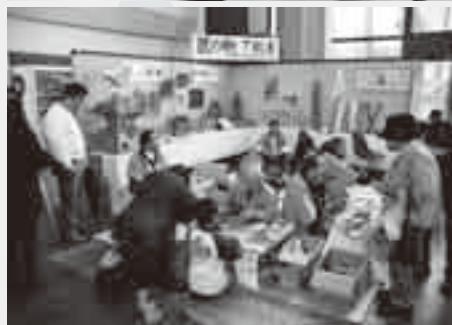
工芸品作りの体験コーナーも

収穫の秋、食欲の秋。今年も秋の恒例イベント「産業まつり」が、国際文化会館を会場に開かれます。農家の皆さんが丹精込めて育てた農産物の共進会や伝統工芸品の展示をはじめ、即売会、特別企画と、イベントが盛りだくさん。家族そろって出掛けてみませんか。