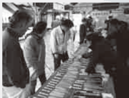
さまざまな商品が並びます

*会場の駐車場は大変混雑します。マイカーを避け、コミュニティバスを利用してください。