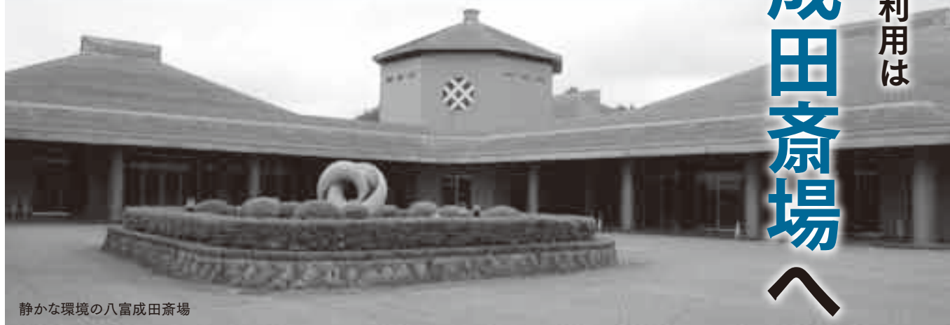
静かな環境の八富成田斎場