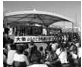
さまざまな催しが