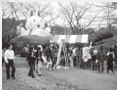
楽しいアトラクションがいっぱい