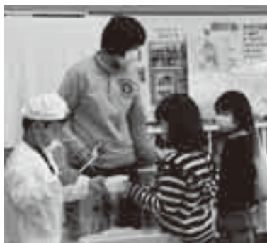
給食の準備も先生と一緒に

的です。授業中や休み時間・給食・学校行事など、多くの機会に全校の子どもたちと接することに よって、小規模学校支援教員は、子どもたちの頼れる存在となり、少人数ならではの親密な関係を築いています。 ※くわしくは学務課(☎20・1581)へ。