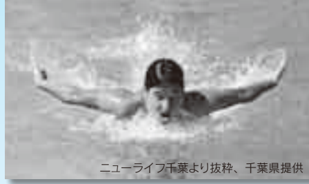
若潮国体での迫力ある泳ぎ