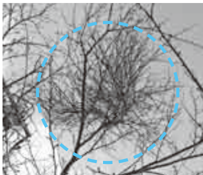
てんぐ巢病にかかった桜(点線内が病気の枝)

てんぐ巢病は、木の枝の一部から小枝が多数発生して竹ぼうき状になり、天狗が巣を作ったような症状になる病気です。