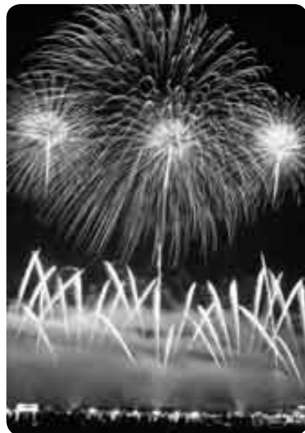
秋の成田の風物詩に、大勢の観客が沸いた

約8,000発の花火が秋の成田の夜空を鮮やかに染め上げる「NARITA花火大会in印旛沼5th」が10月16日、八代地先の北印旛沼湖畔で行われました。この日、会場に訪れた観客は約7万人。市制56周年にちなんだ“尺玉56連発”や音楽に合わせて打ち上がる“花火ファンタジア”、直径約60cmの大玉“2尺玉”に、観客たちは歓喜の声を上げていました。