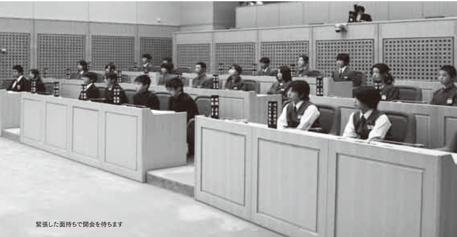
緊張した面持ちで開会を待ちます