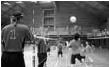
ネット際の攻防が

※申し込みは11月26日(金)までに市体育協会事務局(生涯スポーツ課・☎20-1584)へ。