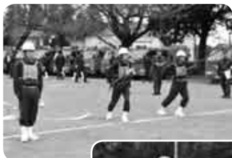
船形チーム (小型ポンプの部)