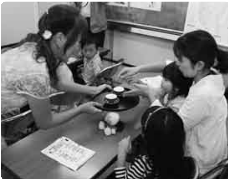
台湾茶道の体験も

外国人と市民の交流を深めようと10月17日、中央公民館で「国際市民フェスティバル」が行われました。テーマは「みんなで広げよう世界のきずな」。中庭に設置されたペルーやイラン・スリランカ・メキシコ・モンゴルなど世界各国の屋台には、普段はなかなか味わうことのできない名物料理を求めてたくさんの方が並びました。また、講堂では、各国の鮮やかな民族衣装のファッションショーや、ダンス・演芸などが披露され、会場は大盛り上がりでした。ファッションショーに参加した子どもたちは「かわいい衣装を着られてうれしい」と大満足の様子でした。