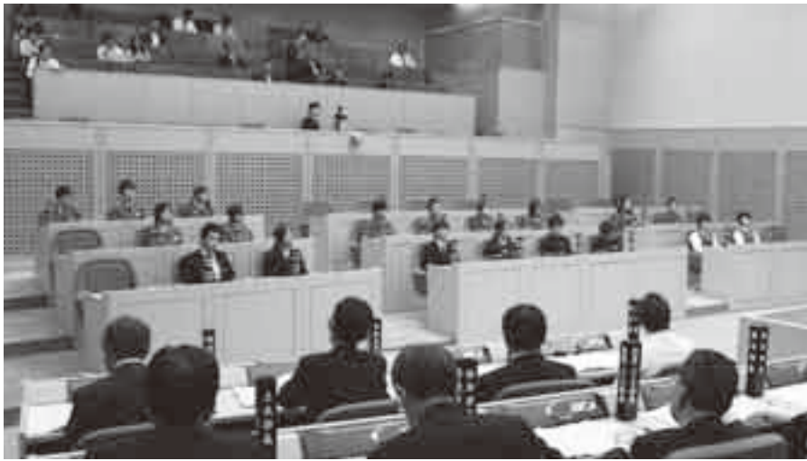
答弁を聞く中学生議員

ん予防ワクチンは、希望者を対象とする任意の予防接種ですので、予算額以上の申請があった場合でも、接種した人全員に助成できるよう対応したいと考えています。費用については、子宮頸がん予防ワクチン接種費用の助成は、成田市独自の事業として行っているもので、その財源は、皆さんから納めていただく市民税などであ