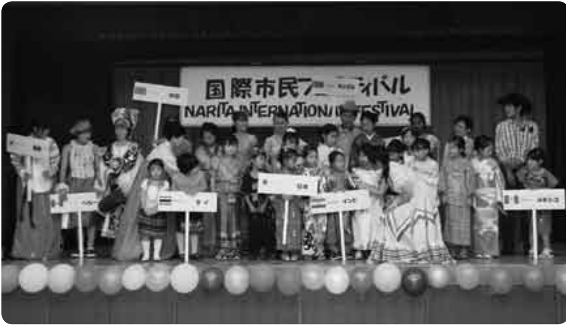
色とりどりの衣装が勢ぞろい