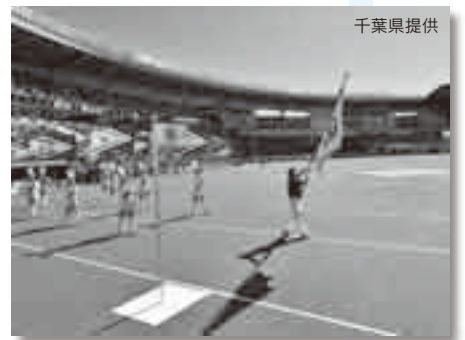
総合開会式で行進する平本さん(右)