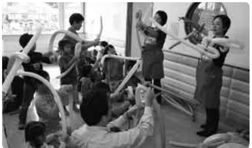
親子で楽しめるイベントも

健康づくりに役立つさまざまな催しが行われる「健康・福祉まつり」が10月16日・17日、保健福祉館を会場に開催されました。会場には、体脂肪測定・ストレスチェックといった、健康維持に役立つ各種コーナーが設けられたほか、ミニトレインの運行や人形劇など、子どもたちが楽しめるイベントも盛りだくさん。この機会に自分や家族の健康を見直そうと多くの家族連れが訪れ、多彩な催しの数々を楽しんでいました。