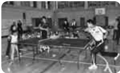
こんしん 渾身のスマッシュはラケットに当たるか

スポーツ選手と触れ合うことで、小学生にスポーツの楽しさを知ってもらおうと10月21日、「スポーツ選手活用体力向上卓球教室」が久住第二小学校で開かれました。