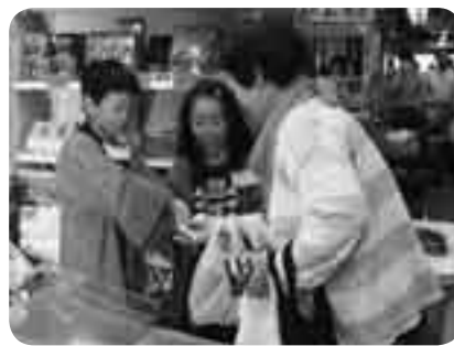
お釣りもしっかり渡せるよ

子どもたちに食べ物の流通の仕組みを知ってもらおうと10月23日、成田市場で「市場探検隊」が行われました。参加したのは28人の小学生。市内の農家で野菜を収穫したり、マグロの競りを体験したりしました。職場体験では、魚屋・漬物屋などに分かれて、商品の販売をお手伝い。子どもたちは、お客さんを呼び込もうと大きな声を出して宣伝したり、商品を買ってくれたお客さんにお釣りを渡したりと、かわいい売り子として市場を盛り上げ、大活躍しました。