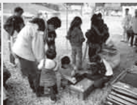
かわいい動物との触れ合いも