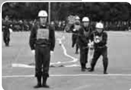
台方チーム (ポンプ車の部)

各地区の消防団が日々の訓練成果を競う「成田市消防操法大会」が10月24日、大栄B&G海洋センター運動場で開催されました。競技はポンプ車の部と小型ポンプの部の2部門で、実際に放水を行わない「空操法」で実施。参加した31チームの消防団員たちは、それぞれの仕事の傍ら早朝や夜間に訓練を重ねて培った操法技術を披露しました。