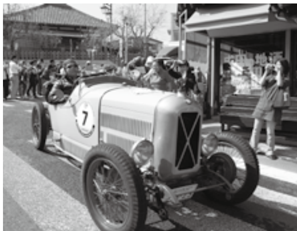
さまざまなクラシックカーが走る

※当日、成田山表参道周辺は混雑が予想されます。事故防止・競技進行に皆さんのご協力をお願いします。くわしくは観光プロモーション課(☎20-1540)へ。