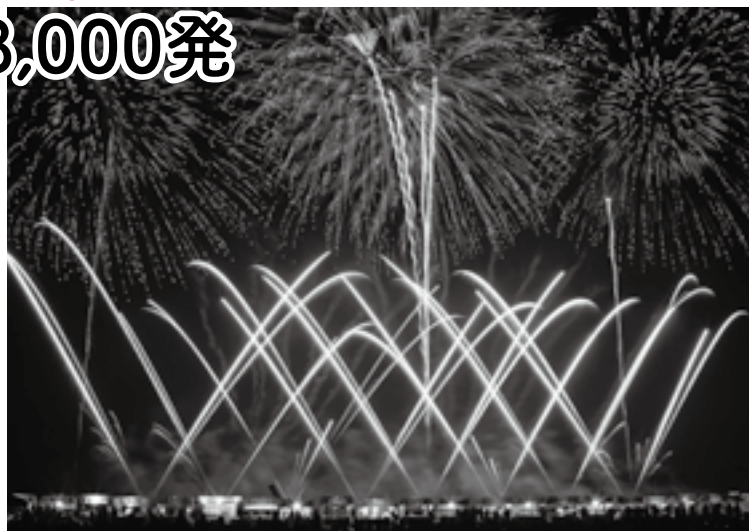
8,000発の光と音の祭典

約8,000発の花火が秋の夜空を鮮やかに染め上げます。北印旛沼湖畔に咲く大輪の花火を堪能してください。