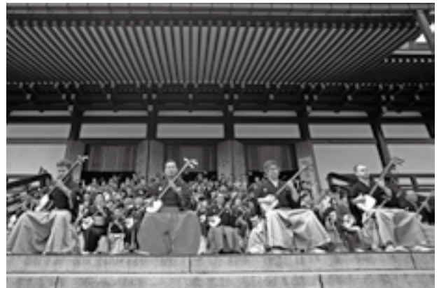
本堂前での大演奏