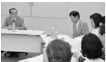
まちづくり茶論で意見交換