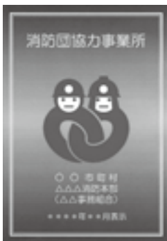
消防団協力事業所表示証

消防団活動に積極的に協力している事業所に対して市消防本部が表示証を交付し、地域防災体制の充実を図るための制度です。