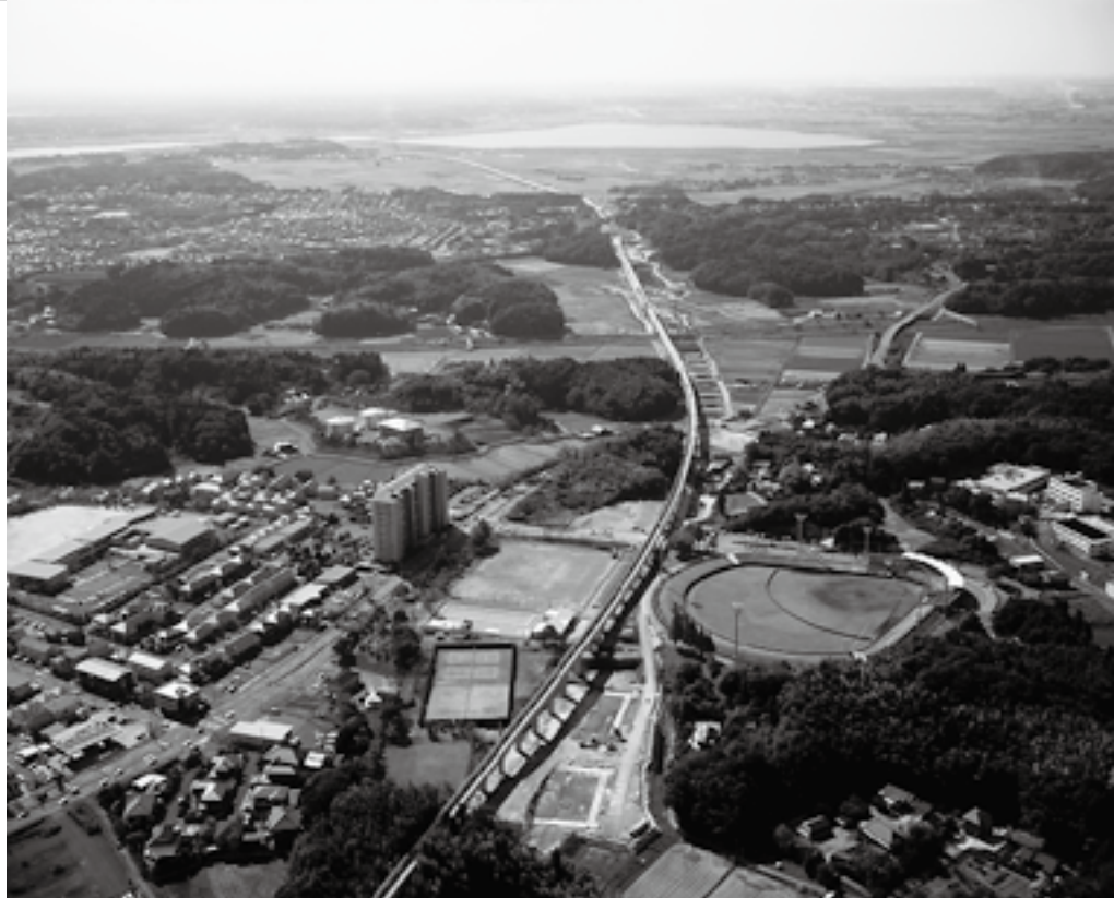
大谷津運動公園を通り都心へ向かう

輸送力の増強は、将来予測される成田空港の国際航空需要の増加に対し、大きな効果があると期待されています。