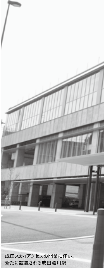
成田スカイアクセスの開業に伴い、新たに設置される成田湯川駅

最高時速160キロメートルでの運行は、日本の在来線(新幹線を除くすべての列車)で最速です。