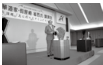
国際交流協会講演会で