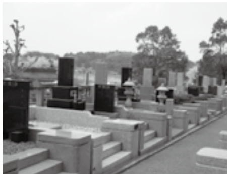
適切な管理をお願いします

霊園内施設の維持管理は、墓地の使用を許可された人の管理料で賄われていますが、この管理料は、公共部分(広場、道路、駐車場、緑地など)を管理するためのもので、墓地内は各自で清掃することになっています。清掃せず草だらけにしていると隣接する墓地の利用者に迷惑を掛けることになります。管理の時間が取れない人は、墓地の清掃を代行する制度もあります。