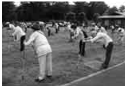
腰やひざの負担を軽減