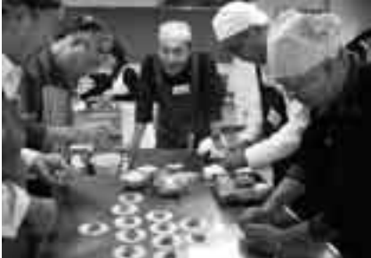
ギョーザ作りに挑戦

日時=5月16日・30日、6月13日、7月11日・25日の日曜日(全5回) 午前10時～午後1時