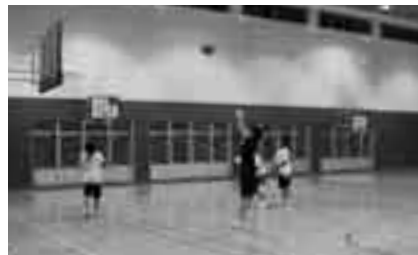
アリーナもご利用を