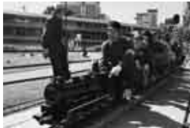
大人も子どもも楽しめます

※駐車場がありませんので、市役所の駐車場または公共交通機関を利用してください。ミニSLへの乗車は無料です。くわしくは公園緑地課(☎20-1562)へ。