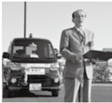
青色回転灯パトロール車出発式で