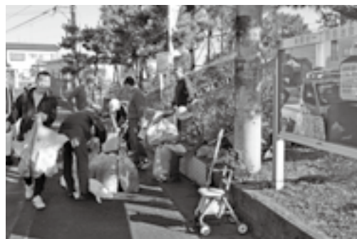
地域で協力して街をきれいに