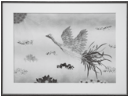
数年間は鮮やかな色を楽しめる

押し花に欠かせないのが、素材集め。理想の作品を作るためには、季節ごとの草花を集め、押し乾燥させておかなければなりません。いざ制作するときになって素材がなくては困るので、年間を通して自宅の庭で育てたり花屋で購入したり、道端で摘んできたりしています。