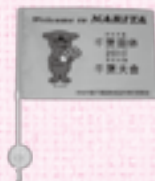
サポーターフラッグ

※申込書は実行委員会ホームページ( http://www.city.narita.chiba.jp/sisei/sosiki/kokutai/stc0066.html )からもダウンロードできます。くわしくは同事務局(73-2115)へ。