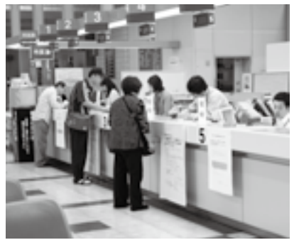
手続きは余裕を持って