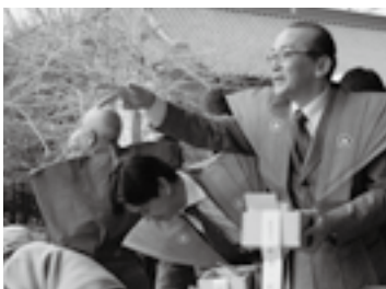
宗吾霊堂節分会で