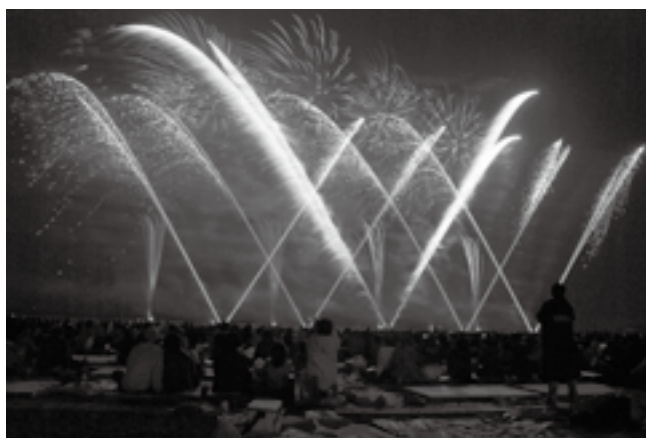
幻想的なひとときを

約7,000発の花火が秋の夜空を鮮やかに染め上げます。今年は市制55周年を記念して「尺玉5連発」を打ち上げます。北印旛沼湖畔に咲く大輪の花火を堪能してください。