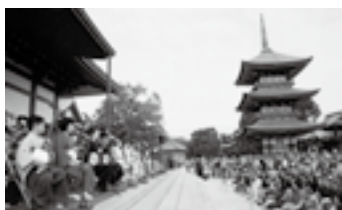
総勢100人による津軽三味線の大演奏会

毎年成田の秋のイベントとして開催されている「御利生祭 成田弦まつり」。弦楽器の響演を中心に、門前成田寄席(落語)など、さまざまなイベントが催されます。