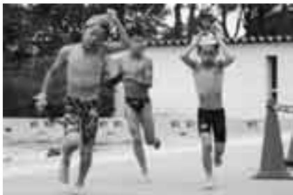
スイムを終えバイクに向かう