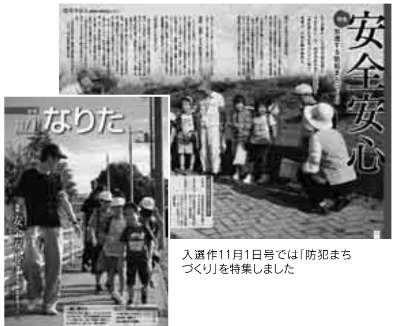
入選作11月1日号では「防犯まちづくり」を特集しました

平成21年全国広報コンクールで「広報なりた」(平成20年11月1日号)が、広報紙(市部)部門で3席に入選しました。同コンクールは、全国自治体の広報紙・ホームページなど広報媒体を対象に毎年実施されているもので、広報紙部門での入選は昨年の5席・読売新聞社賞に続き2年連続となります。今後とも市民の皆さんに親しまれる紙面作りを心掛けていきますので、「広報なりた」をよろしく願います。