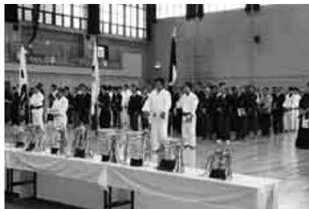
開会式に臨む成田市選手団

成田、旭、匝瑳、香取、銚子の5市による「千葉県東部五市体育大会」が5月12日・16日・17日、香取市を会場として開催されました。成田市は20種目中11種目で優勝。他市を圧倒し、4年連続・23回目の総合優勝を果たしました。