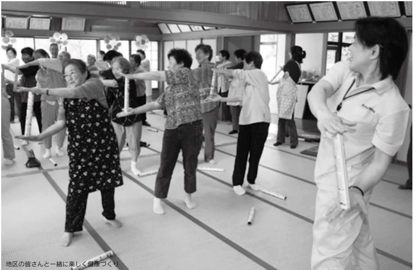
地区の皆さんと一緒に楽しく健康づくり