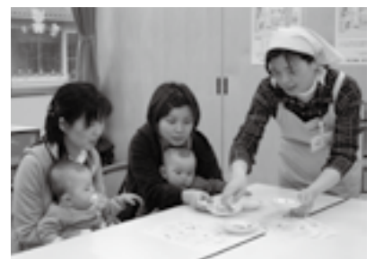
赤ちゃんの栄養相談もしています

あなたの周りでもさまざまな健康づくりの取り組みを行っていますので、気軽に声を掛けてください。