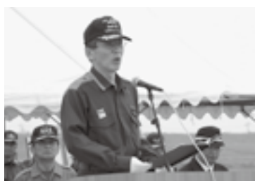
水防演習で団員たちを激励