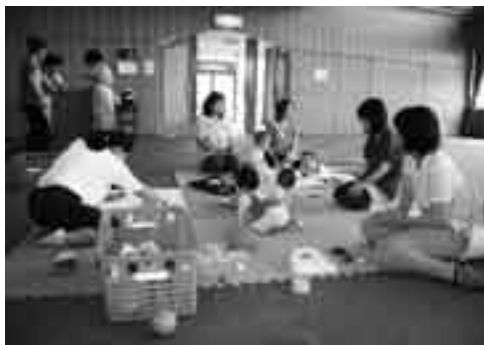
楽しい時間を過ごしましょう

日時 7月14日、8月11日、9月8日、10月13日、11月10日、12月9日、1月12日、2月9日、3月9日の火曜日 午前9時30分～11時 会場 保健福祉館大栄分館