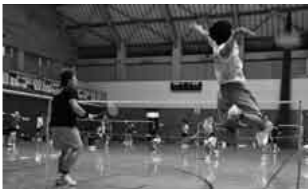
ジャンプスマッシュ!