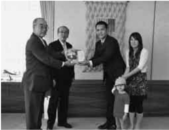
成田高速鉄道アクセス株式会社から記念品が