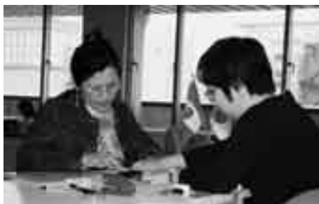
市役所の手続きなど、身近な相談に応じます