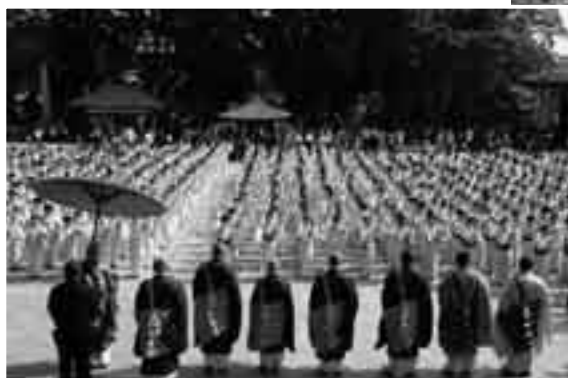
境内は踊り一色に