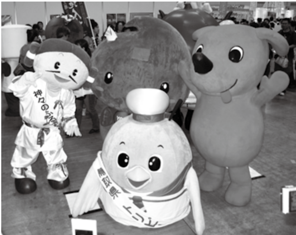
「旅フェア2009」での「ご当地キャラクター撮影会」

市では「観光のまち成田」をPRするため、観光キャラクターのデザインと愛称を募集します。採用されたキャラクターは着ぐるみを作成するほか、さまざまな観光事業などに活用し、市の観光をPRしていきます。皆さん、ぜひ応募してください。