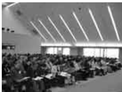
学習意欲を燃やす受講生たち(開講式)

※緑地環境課程は、授業のほかに実習農地の管理作業があります。また、講義運営ボランティア「運営委員」も同時に募集します。くわしくは生涯学習課(☎20-1583)へ。