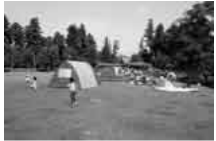
ぜひご利用を(坂田ヶ池公園キャンプ場)