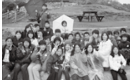
たくさんの友達を作ろう

「NARITA少年の翼」の団員として、友好都市ニュージーランド・フォクストンで一緒に国際交流をしませんか。 派遣期間 =8月19日(水)~27日(木) 派遣先 =ニュージーランド・フォクストン 国内研修 =5月~8月に5回程度(宿泊研修を含む) 応募資格 =市内在住の小学5年~中学2年生で国内・海外研修にすべて参加し、計画に従い規律ある団体生活ができる人 定員 =24人程度(応募者多数は抽選) 参加費 =150,000円程度(事前・事後研修費を含む。原油高騰の場合は追加料金の可能性あり) 申込方法 =4月20日(月)(必着)までに各公民館または成田青年会議所にある所定の応募用紙に必要事項を書いて(社)成田青年会議所事務局「少年の翼係」(〒286-0026 本町342)へ ※くわしくは同事務局(☎23-1900、土・日曜日・祝日は休み)へ。