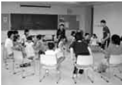
ゲームをしながら英語に親しもう

期日=4月11日・18日・25日、5月9日・16日・23日・30日の土曜日(全7回) 時間=午後2時~3時30分 会場=大栄公民館 内容=英語発音やカタカナなどの言葉を遊びを通して学ぶ 対象=5歳~小学2年生と保護者 定員=20組(先着順) 参加費=無料 ※申し込みは午前9時~午後5時に大栄公民館(☎73-7071、月曜日・祝日は休館)へ。