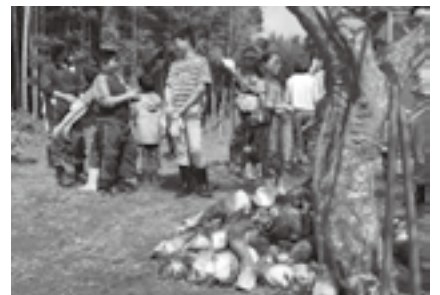
たけのごたくさん採れました

日時=4月11日(土) 午前9時~正午 会場=八生公民館 対象=小学生と保護者 定員=15組(応募者多数は抽選) 参加費=無料 申込方法=3月31日(火)(必着)までに往復はがきに住所・氏名・学校名・学年・電話番号・参加保護者名を書いて八生公民館(〒286-0846 松崎317)へ ※くわしくは同館(☎27-1533、月曜日・祝日は休館)へ。