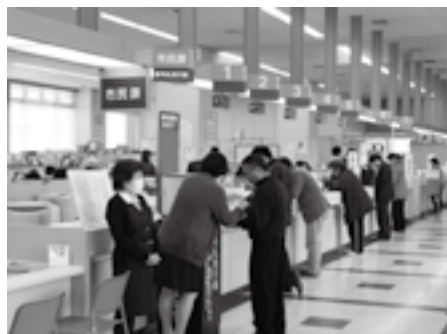
手続きは余裕を持って

必要なもの 国民健康保険証、国 民健康保険高齢受給者証、介護 保険証、後期高齢者医療保険