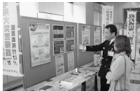
防火対策の確認を

日時＝3月2日(月)～6日(金) 午前8時30分～午後5時30分 (6日は午後2時まで) 会場＝市役所1階ロビー