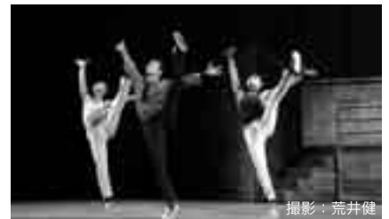
名作をぜひご覧ください