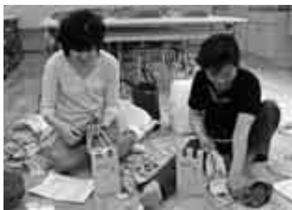
身近なものでできるリサイクルを

日時＝3月7日(土) 午後1時～4時 会場＝リサイクルプラザ2階学習室 定員＝15人(初めての人を優先して先着順) 参加費＝無料 持ち物＝木綿の布50本(5cm×80cm)、はさみ、裁縫道具 ※申し込みはリサイクルプラザ(☎36-1000、月曜日は休館)へ。