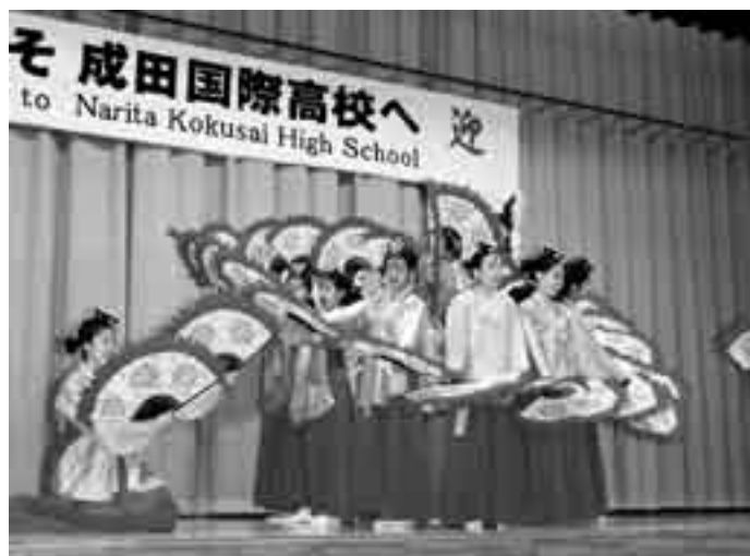
民族舞踊を披露する果川外国語学校の生徒たち