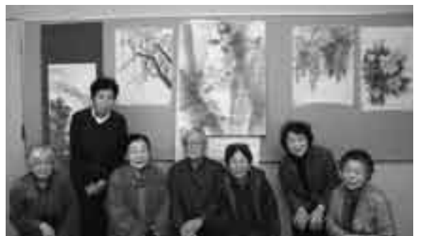
墨の世界を味わいませんか

描いた作品は、みんなで批評し合います。水墨画歴は20年生から1年生まで。ベテランの味のある作品や初級者の新鮮でのびのびとした作品がありますから、楽しく鑑賞していきます。描いた作品は、自宅などに飾るのももちろん、展覧会に出品することもあるんですよ。そして、年に一度、感性を磨きに美術館へ勉強会に出掛けるのが恒例の行事になっています。