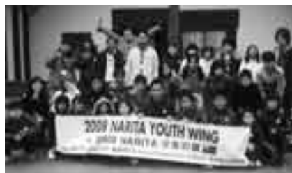
一生の友だちと最高の感動を作りませんか

「NARITA少年の翼」のチームリーダーとして、団員とともにニュージーランド・フォクストンで国際交流してみませんか。 派遣期間=8月19日(水)～27日(木)の9日間(宿泊研修を含む10回程度の研修とリーダー研修を予定) 派遣先=ニュージーランド・フォクストン 応募資格と定員=市内在住・在勤で計画に従い団員とともに研修に参加できる18～25歳の男女・各4人 参加費=150,000円程度 申込方法=1月31日(土)までに写真を貼った履歴書を郵送で(社)成田青年会議所事務局(〒286-0026 本町342)へ 面接日時と会場=2月8日(日) 午前9時30分から・中央公民館 ※くわしくは平日の午前10時～午後4時に同事務局(☎23-1900)へ。