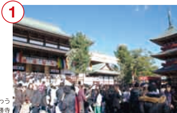
初詣での人でにぎわう 成田山新勝寺