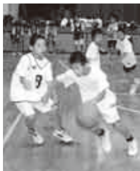
素早いドリブルで ディフェンスを突破

ほくたちジュニアファイブは、6年生10人、5年生6人、4年生7人、3年生12人、2年生5人、1年生1人の計41人で、週4日間、神宮寺小学校・玉造小学校・美郷台小学校の体育館で活動しているバスケットボールチームです。 チームメイト同士の仲がよく、明るい雰囲気の中でバスケットボールを楽しんでいるほくたちですが、どのチームにも負けないくらい、練習には真剣に取り組んでいます。