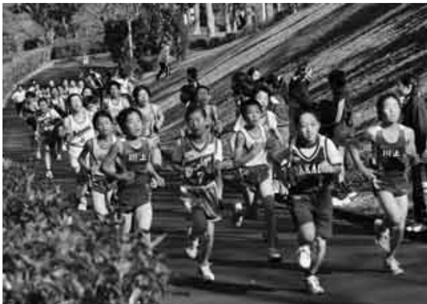
苦しい上り坂にも負けません