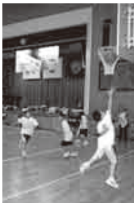
ドリブルからのシュート練習

バスケットボールは、パスワークをはじめとする連携プレーが重要なスポーツなので、練習中は互いに声を掛け、チームメイト同士の意思を確認し合うことを特に心掛けています。 現在のチームの課題は、ディフェンスの強化。フェイントを読んだり、パスカットのタイミングをつかんだりするため、3対3や5対5などの実戦形式のメニューに力を入れています。監督も、練習を通じて連携プレーのスピードが向上するよう、さまざまなアドバイスをしてください。 バスケットボールをやっている、一番うれしいのは試合に勝ったとき。これからも、一つでも多くの勝利を皆で分かち合えるよう、チーム一丸となって練習に取り組んでいきたいと思っています。