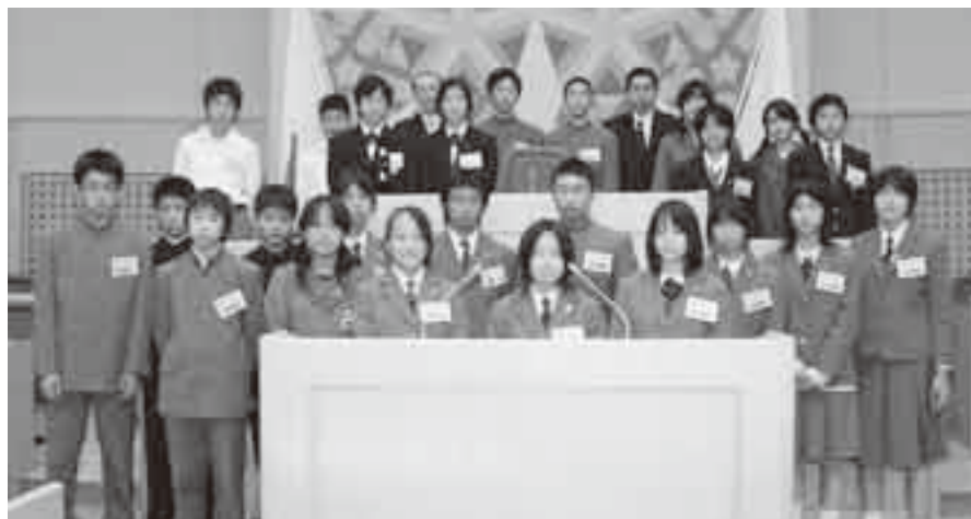
出席した中学生議員(敬称略)

今後、環境負荷の少ない、環境に配慮した、持続可能な「循環型社会」の形成のため、市民一人一人が環境保全意識を高めるとともに、市民・事業者との協力の下で、「自然と文化を育み、地球にやさしい環境都市成田」の実現に努めてまいります。