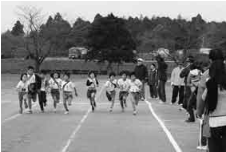
号砲を合図に一齐にスタート