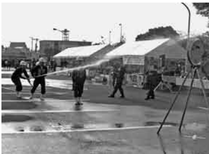
優勝した大本山成田山新勝寺チームの演技