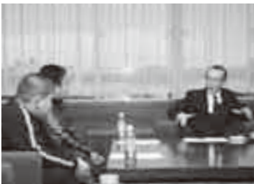
全日本小学生相撲優勝大会出場者を激励する小泉市長