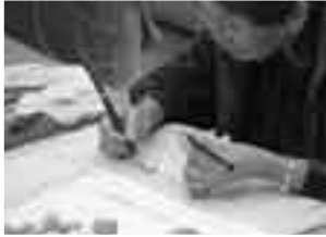
繊細かつ大胆な筆使い