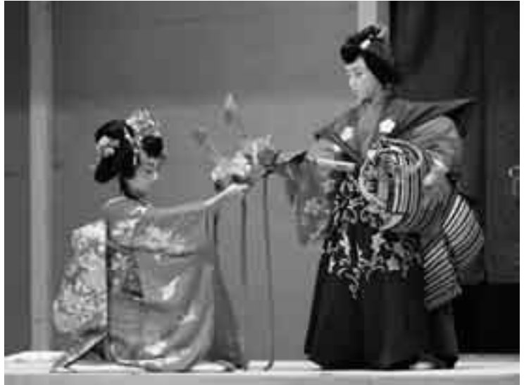
迫力の演技に、観客たちは魅了されました

大栄地区の伝統芸能として親しまれている「伊能歌舞伎」(市指定無形民俗文化財)の定期公演が11月16日、大栄公民館で行われました。子ども歌舞伎「絵本太功記十段目 尼崎閑居の場」では、例年にも増して練習を重ねた子どもたちが主君への謀反を起こした武智光秀の物語を熱演。また「近江源氏先陣館盛綱陣屋」ではベテラン役者たちが迫力ある演技を披露しました。地元役者の見事な演技に、観客からは大きな拍手が送られていました。