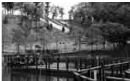
ウォーキングには最適な季節(坂田ケ池総合公園)

※参加を希望する人は当日直接集合場 所へ。くわしくは市レクリエーショ ン協会事務局(生涯スポーツ課・☎ 20-1584)へ。