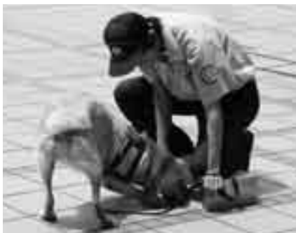
麻薬を見つけるんだワン

期日＝6月6日(金) 集合時間と場所＝午前9時・市役所1階ロビー(午後3時30分解散) 見学コース＝給食センター～麻薬探知犬訓練センター～三里塚コミュニティセンター(昼食)～日本航空整備工場 対象＝市内に住んでいる人 定員＝30人(先着順) 参加費＝無料 ※昼食は各自で用意してください。申し込みは広報課(☎20-1503)へ。