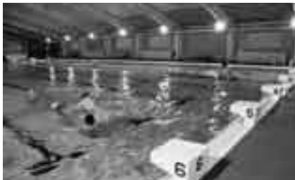
日ごろの運動不足を解消!

※水着、キャップを持参してください。申し込みは生涯スポーツ課(☎20-1584)へ。