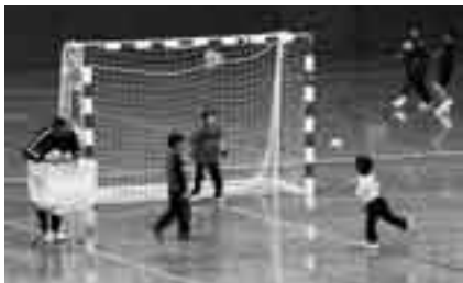
未来の五輪選手が誕生するかも

期日＝4月5日(土) 時間＝午前10時から 会場＝市体育館アリーナ 対象＝市内小学生 参加費＝500円(保険代) ※申し込みは4月3日(木)までに市ハンドボール協会事務局・岡本さん(☎26-2162)へ。