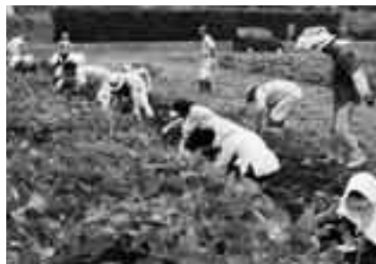
秋の恵みを収穫(緑地環境課程)

※受講日程や内容などは変更する場合があります。緑地環境課程は、ほかに実習農地の課外学習や管理作業などもあります。各課程1回ずつ、受講生以外の人でも参加できる公開講座があります。また、講義運営ボランティア「運営委員」も同時に募集します。くわしくは生涯学習課(☎20-1583)へ。