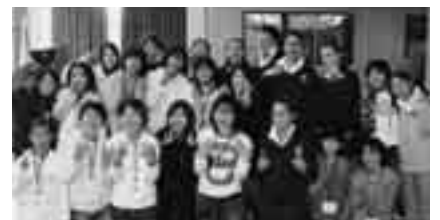
成田と友好都市を結ぶ翼たち

「2008NARITA少年の翼」の団員として、友好都市のニュージーランド・フォクストンと一緒に国際交流をしてみませんか。国内研修・海外研修を通してふれあい、楽しみ、感動を与える青少年健全育成事業です。 派遣期間＝7月29日(火)～8月5日(火)(ホームステイを含む) 派遣先＝ニュージーランド・フォクストン 国内研修＝宿泊研修を含め5回程度 応募資格＝市内在住する小学5年～中学2年生で、国内・海外研修において、計画に従い規律ある団体生活に適応でき、原則として、夏季に日本を訪れるフォクストンの子どもたちのホームステイ受け入れが可能な人 募集人数＝24人(応募者多数は抽選) 参加費＝150,000円程度 応募方法＝4月13日(日)(必着)までに、写真を貼った申込書を郵送で(社)成田青年会議所事務局(〒286-0026本町342)へ。申込書は同事務局または各公民館にあります ※くわしくは同事務局(☎23-1900、土・日曜日は休み)へ。