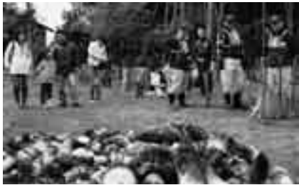
今年も授かる自然の恵み

日時=4月12日(土) 午前9時~正午 会場=八生公民館 対象=小学生親子 定員=15組(応募者多数は初めての人を優先に抽選) 申込方法=4月1日(火)(必着)までに、往復はがきに住所・氏名・学校名・学年・電話番号・参加保護者名を書いて八生公民館(〒286-0846 松崎317)へ ※参加費は無料です。作業ができる服装でお越しください。くわしくは午前9時~午後5時に同館(☎27-1533、月曜日・祝日は休館)へ。