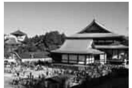
開基1070年を迎える成田山新勝寺

3月31日までの期間、県内で「ちば観光キャンペーン」が開催されます。昨年の「ちばデスティネーションキャンペーン」を引き継いで行う全県キャンペーンで、期間中は県内各地でさまざまな企画・イベントが実施されています。成田市内でもこの期間中に全国より多くのお客様をお迎えするためさまざまな催しが実施されます。市内で開催される主な企画・催し物(問い合わせ先) ○成田山新勝寺特別企画・・・写経体験、成田山開基1070年祭記念奉祝歌発表会(新勝寺企画課 ☎22-2111) ※くわしくは観光プロモーション課(☎20-1540)へ。