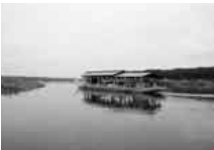
美しい印旛沼を後世まで