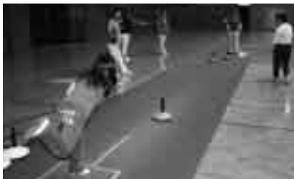
力加減が重要です

日時=8月11日(土) 午前9時~午後4時 会場=市体育館アリーナ 対象=どなたでも(1チーム3人で編成) 参加費=1チーム4,500円(昼食代を含む) ※申し込みは7月27日(金)までに市レクリエーション協会事務局(生涯スポーツ課・☎20-1584)へ。