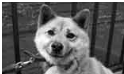
大事な家族の一員です

期日=7月25日~8月29日の毎水曜日 時間=午前10時~11時30分 会場=千葉県動物愛護センター(富里市) 内容=犬などの安全な接し方、ペットからうつる病気、施設見学など 対象=小学4~6年生とその親 定員と参加費=各日5組(先着順)・無料 ※申し込みは同センター(☎93-5711)へ。