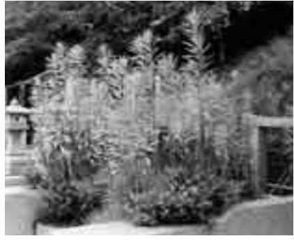
お隣に迷惑を掛けていませんか

霊園内施設の維持管理は、墓地の使用を許可された人の管理料で賄われています。しかし、この管理料は公共部分(広場、道路、駐車場、緑地など)を管理するためのもので、墓地内の清掃については各自で行うことになっていきます。清掃せずに草だらけにしていると、隣接する墓地使用者に大変迷惑を掛けることになります。思うようにお墓の管理の時間が取れないという人に、管理組合が墓地の清掃を代行する制度もありますので組合事務所(☎36・2292)まで申し込んでください。