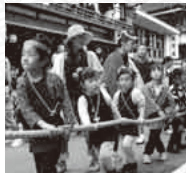
法被姿もきまつてるね

現山を出発する御輿を出迎えて、JR成田駅中央口駅前広場でお囃子と踊りの競演が行われます。この日も午後10時まで山車・屋台が街中をにぎやかに練り歩きます。