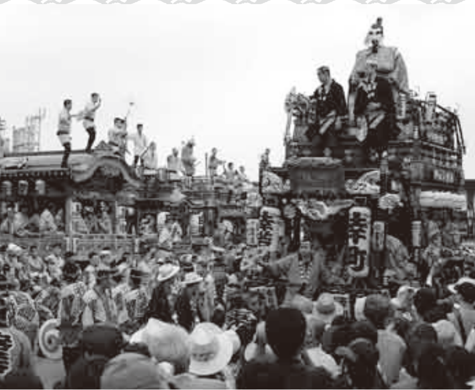
山車や屋台など祭りの主役が駅前にも勢揃い