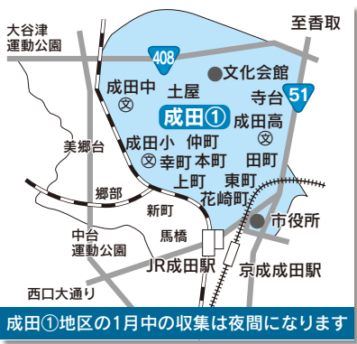
成田①地区の1月中の収集は夜間になります

は1月4日(木)から受け付けします(土・日曜日、祝日は除く)。なお、年末は申し込みが込み合いますので、収集が年明けになることもあります。