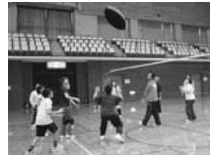
初心者でも気軽に楽しめます

※申し込みは12月22日(金)までに電話で市レクリエーション協会事務局(生涯スポーツ課・☎20-1584)へ。