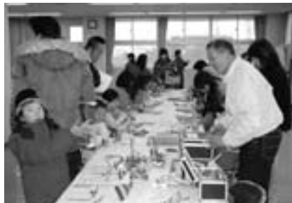
家族皆でお越しください