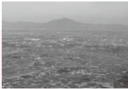
茨城県のシンボル「筑波山」