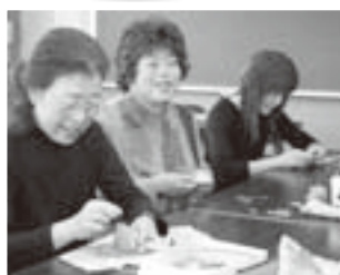
世間は作業中、質問は弾みつき

製作は、型紙に沿って生地の色や柄を選ぶ「色合わせ」から始めます。つい「あの色も、この柄も」と