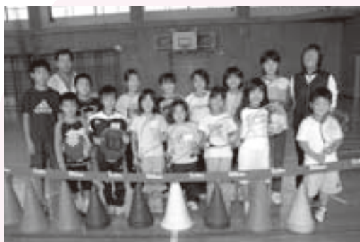
初めてでもすぐ楽しめるよ

ラケットに当たるか教えてもらって、だんだん自分の打ったボールがネットを越えるようになりまし。そして、自分の打ったボールを相手が返してくれ、ラリーが続くよう