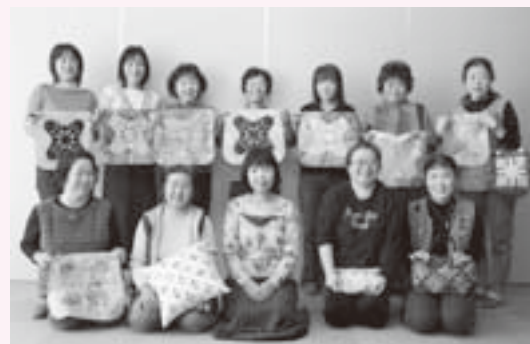
新しいものにもどんどんチャレンジします

欲張ってしまい、最初のイメージとは掛け離れてしまうことも。一片の生地の色あいを変えるだけで、雰囲気全然違うものになるから不思議です。次に、選んだ生地をつなげて、表地と裏地の間に綿を入れて一針一針丁寧に縫い合わせます。最後に持ち手やファスナーを付ける「仕立て」を経て完成です。ここまでできて、パーツがうまく合わずに残念な思いをしたこともあるんですよ。