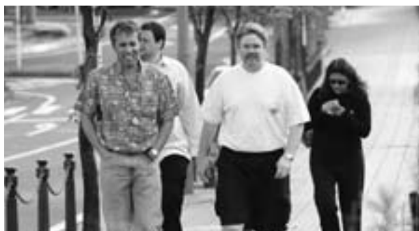
外国人も住みよい成田に