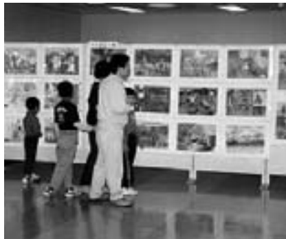
世界各国の絵画が一堂に展示されます

第9回国際こども絵画交流展が次のとおり開催されています。 期日＝11月12日(日)まで 時間＝午前9時～午後3時30分 会場＝成田山新勝寺大本堂第二講堂 ※入場は無料です。くわしくは生涯学習課(☎20-1583)へ。