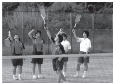
上級生が指導して

わたしたち大栄中学校ソフトテニス部は1年生が男子10人、女子6人、2年生が男子7人、女子5人、3年生が男子8人、女子4人の計40人で、毎日、校内にあるテニスコートで練習しています。