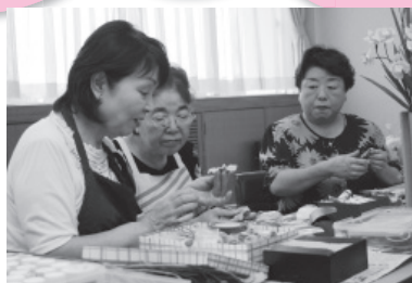
指の上で花びらを咲かせます

創作は、粘土に油絵の具を練り込んで彩色するところから始まります。次に、指の上で花びらや葉に形取つていき、出来上がった部位を組み合わせて花の姿に。最後に油絵の具で濃淡を付けたら完成です。上達すると、色といい形と