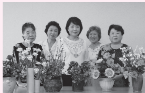
一緒にパンの花を作りませんか

つまでも色あせないし、型崩れもしないので、家の中に飾つたり、友人にプレゼントしたりと大切な一品にもなっています。