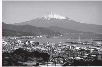
日本一の富士山の眺めは最高