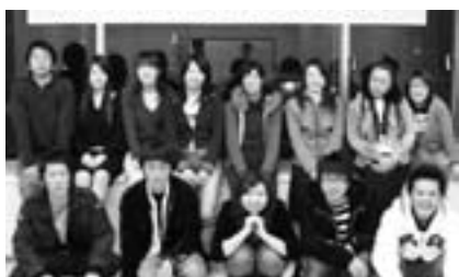
あなたも参加しませんか