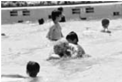
暑さを忘れて楽しめます

※平日は小学校の授業で使用する場合があります。くわしくは大栄B&G海洋センター(☎0478-73-5110・月曜日は休館)、または生涯スポーツ課(☎20-1584)へ。