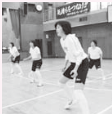
一球ごと集中して

この中には、近隣の中学校だけでなく、高校のチームや県外の有力な中学校のチームとの練習や対戦も含まれていて、こういった経験を重ねることは、いい刺激になるし、自分たちが持ち合わせてい