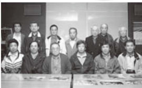
一緒にカメラ片手に出掛けませんか

主な活動は、地域行事や名所での撮影会のほか、毎月第3金曜日に大栄公民館で開催している学習会です。ここでは、日ごろ各々が撮影した写真を持ち寄り、ほかのメンバーとともに見せ合います。自信たっぷりの作品でも、「アングルに工夫が足りない」などと厳しい意見が飛び交うことも。逆に何気なく撮った一枚が高い評価を受けることもあり、あらためて写真の奥深さを感じずにはいられません。