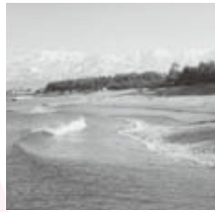
子どものころよく遊んだ岩瀬海岸、遠くは立山連峰

昭和38年と56年に日本海側を襲った大雪は「38豪雪」「56豪雪」と呼ばれ、出入りは家の2階から。しまいには身動きができなくなり食料が底をつくほどで、70年間の富山での暮らしで忘れられない出来事の一つでした。成田に来て8年、雪がなくて体によさしい風土でとても暮らしやすいですね。冬の厳しさがまったく違います。周辺には緑が多く四季折々の花見ができ、街もとてもきれいだと思います。今では生涯大学院やグラウンド・ゴルフなどを通して、たくさん友人ができて楽しく暮らしています。