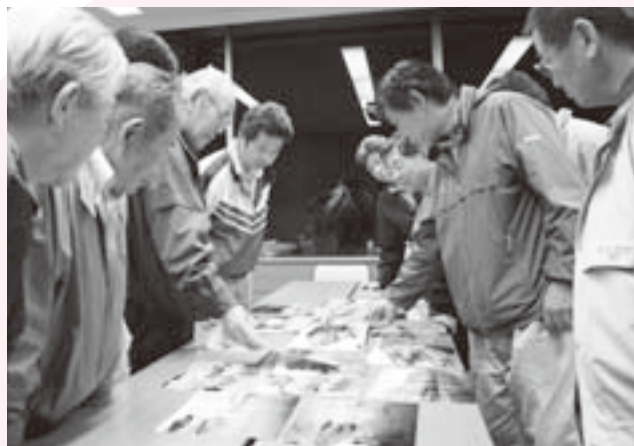
技術向上を目指して日々研究

自分の作品を仲間と見せ合うことで、思いがけないアドバースをもらえたり、人との視線の違いを痛感したりと貴重な時間を共有しています。 写真の魅力は、見たもの・感じたもの、その「瞬間の記憶」を残していけることではないでしょうか。たとえ年月が経ってしまっても、写真を見るとその時の想いがよみがえってきます。現在、公民館での展示会に向けて、みんなで準備中。一人でも多くの人に写真の魅力を伝えていけたらと思います。