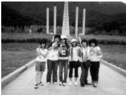
海外での思い出作り

くわしくは同協会事務局(広報課内・☎23-3231)へ。なお、国際情勢などの事情によって、中止となる場合があります。