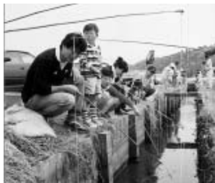
えびがに、どこにいるかな~?

申し込み方法 = 5月31日(水)までに直接または電話で公津公民館(☎26-9610・月曜日は休館)へ。