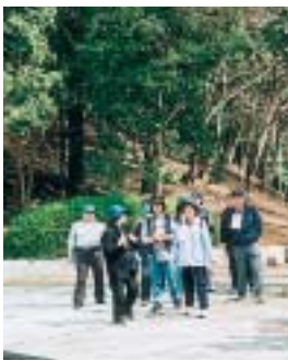
新緑の赤坂公園で

赤坂公園の景色を眺めながらゆっくりと散策する「春のウォーキング大会」を実施します。健康のために運動は大切な要素ですが、いざ始めるとなる