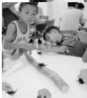
男の子に大人気のカプトムシとあそぼう！