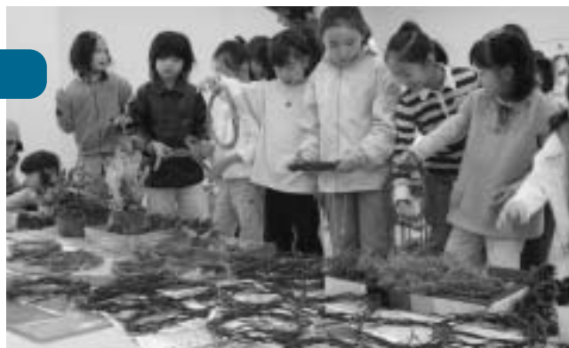
自由な発想で自分だけのクリスマスリース作り