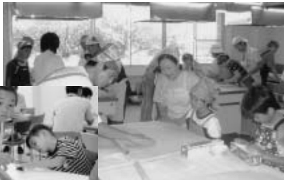
意外と力が必要なそば作り

また、「子育てひろば」では、子育てサポーターによる子育て相談「なかよしひろば」では、育児講座