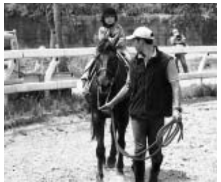
スタッフがやさしくサポート

なかなか接する機会のない馬と、友達や親子でふれあってみませんか。 専門のスタッフが参加者の年齢や体力に合わせてサポートします。 日時 = 5月5日(金・祝) 午後1時から 会場 = セントラル乗馬倶楽部(松崎) 対象 = 小学2年生~50歳くらいまでの市民 定員 = 10人(申し込み多数は抽選) 参加費 = 2,000円(ブーツ・ヘルメットレンタル料・保険代含む) 申し込みは4月23日(日)までに市馬術協会(セントラル乗馬倶楽部内・☎28-4388)へ。