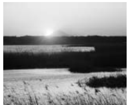
美しい印旛沼を取り戻そう