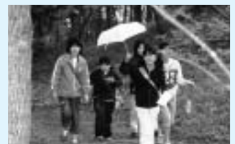
仲間と一緒にゴールを目指せ！

日時 = 5月21日（日）午前9時15分スタート コース = 公津の杜公園周辺 対象 = 5人以内で編成された小学生以上のチーム 参加費 = 500円（小・中学生は300円）参加賞・賞品あり 申し込みは5月10日（水）までに市レクリエーション協会事務局（生涯スポーツ課）へ。