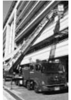
40m級のはしご車(成田消防署)

市では、市民の皆さんに公共施設や市内の移り変わりを見学していただくため、「市内施設見学会」を開催します。 日時=5月9日(火) 午前9時~午後3時30分 集合・解散場所=市役所1階ロビー 見学コース=成田消防署 保健福祉館本館 花植木センター(昼食) 麻薬探知犬訓練センター