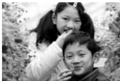
新鮮なイチゴをほお張ろう

対象=市内に住む小学生のいる家族 定員=35家族(応募者多数は、初めての家族を優先して抽選) 内容=サツマイモ、落花生、ナシ、イチゴなどの植え付けと収穫(年間数回) 参加費=年間10,000円(1家族当たり) 申し込み方法=4月28日(金)までに、往復ハガキに住所・家族の氏名・年齢・電話番号を書いて、農業青年会議所事務局(〒286-8585 花崎町760)へくわしくは同会議所事務局(農政課・☎20-1542)へ。