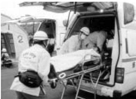
救える命が救えるように、ご協力を

このように件数の増加により、本日に救急車を必要とする人のところへの到着が遅れ、「救える命