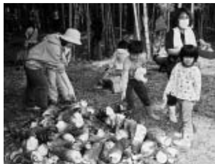
こんなにたくさん採れたよ

持ち物 = 長靴、軍手、ビニール袋、(持っている人は)小刀、くわ、竹びきのこぎり 申し込みは午前9時から直接または電話で八生公民館(☎27-1533、月曜日・祝日は休館)へ。