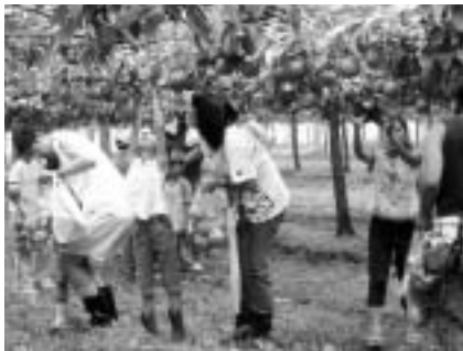
いっぱい採れるかな(ナシの収穫)

対象 = 市内に住む小学生とその家族 定員 = 35家族(応募者多数は、初めての家族を優先して抽選) 内容 = サツマイモ、落花生、ナシ、イチゴなどの植え付けと収穫(年間数回) 参加費 = 年間10,000円(1家族当たり) 申し込み方法 = 4月28日(金)までに、往復ハガキに住所・家族の氏名・年齢・電話番号を書いて、農業青年会議所事務局(〒286-8585 花崎町760 農政課内)へ くわしくは同会議所事務局(農政課・☎20-1542)へ。