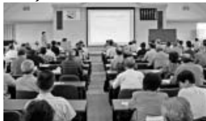
市役所が駿河台の校舎に

申し込み方法 = 3月24日(金)必着)までに、ハガキに「明治大学・成田社会人大学受講申し込み」であることを明記して、希望する課程名(1人1課程)・住所・氏名・年齢・職業(市外の方は勤務先や学校名も)・電話番号を書いて生涯学習課(☎286-8585 花崎町760)へ