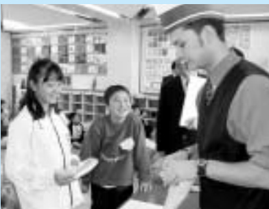
外国人講師による授業

また、本市は、少人数学習推進教員、外国人英語講師、学校図書館司書の配置などに独自の教育施策を進め、学力の向上に取り組んでいるところであります。この恵まれた教育環境を十分に活用し、いっそうの学力向上が図られるよう期待します。