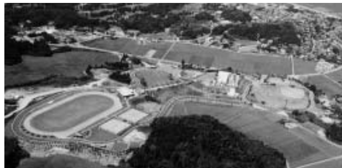
フレンドリーパーク下総全景