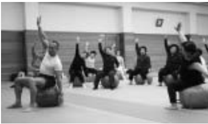
リズムに乗ってストレッチ

日時 = 3月15日(水) 午前9時30分 ~ 11時30分 会場 = 市体育館 対象 = 中・高齢者 内容 = ボールなどを使用した筋力トレーニングやストレッチ 参加費は無料です。申し込みは前日までに電話で市体育館 ☎26-7251)へ。