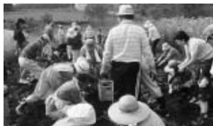
農園での実習(緑地環境課程)

申し込み方法 = 3月24日(金)必着までに、ハガキに「明治大学・成田社会人大学受講申し込み」であることを明記して、希望する課程名(1人1課程)・住所・氏名・年齢・職業(市外の方は勤務先や学校名も)・電話番号を書いて生涯学習課(〒286-8585 花崎町760)へ